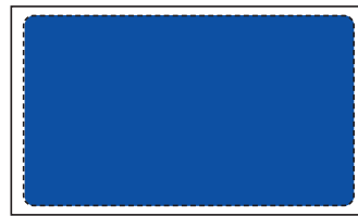
Art. Nr. 043